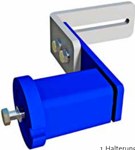
1. Halterung 2. Rosta-Element